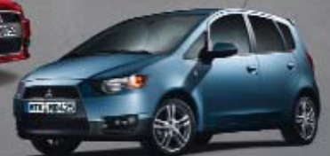
Colt 5-Türer Instyle