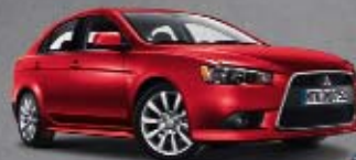
Lancer Sportback Instyle

ENTDECKEN SIE IHR SPORTLICHES TALENT: ENTWEDER IM NEUEN COLT. ODER IM NEUEN LANCER SPORTBACK.